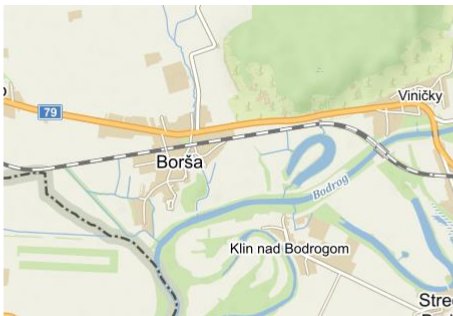
Obrázok 1 Mapa polohy obce

Obec Borša sa nachádza v Potišskej nížine na juhozápadných výbežkoch Zemplínskych vrchov na východnom Slovensku, v okrajovej polohe v rámci okresu Trebišov aj v rámci Košického kraja. Susedí s Maďarskom a tvorí „nárazníkovú zónu“ Tokajskej vinohradníckej oblasti.